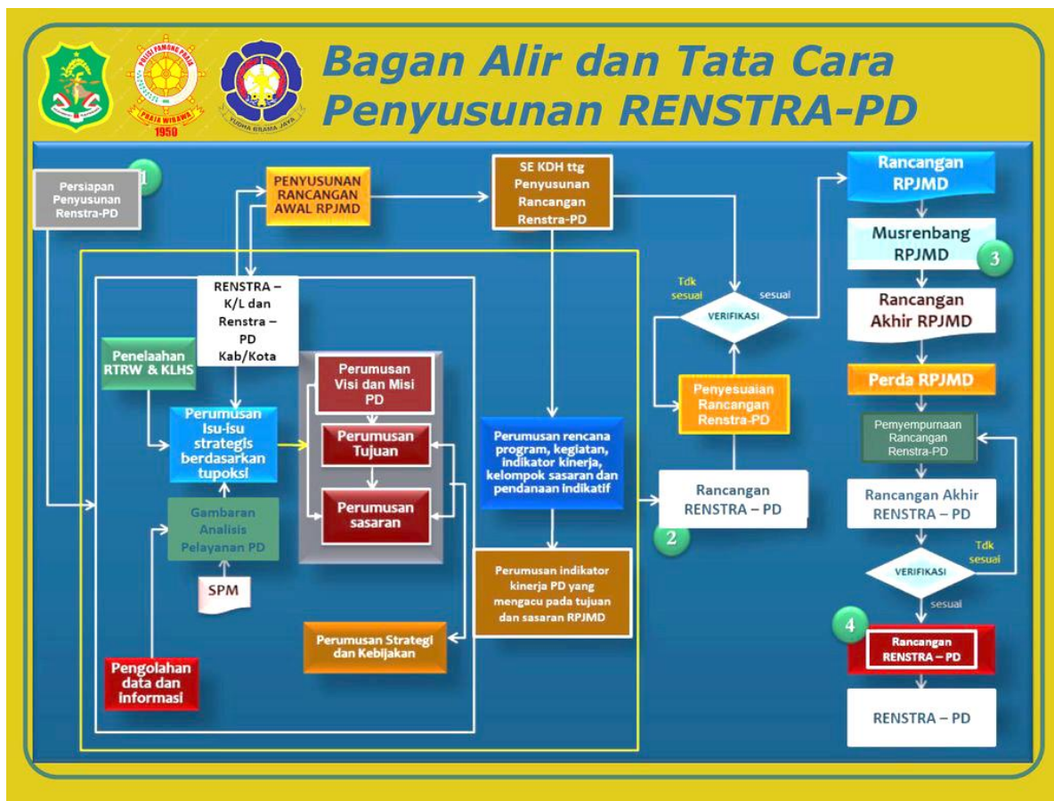
Gambar 1.1 Bagan Alir Penyusunan Renstra-PD

Adapun bagan alir dalam penyusunan Renstra PD 2025-2029 adalah sebagai berikut :