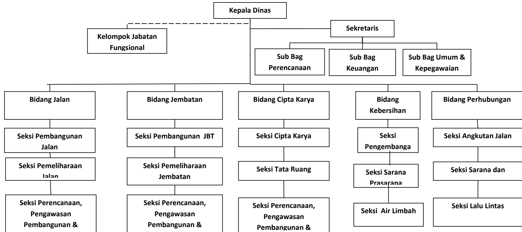
Gambar 2.1 Bagan Struktur Organisasi Dinas Pekerjaan Umum Penataan Ruang dan Perhubungan