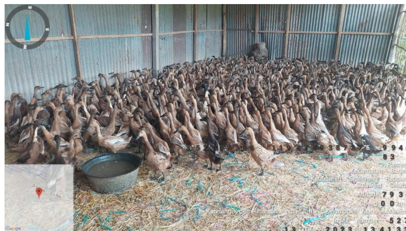
Gambar 2. Penyerahan Pullet Ternak Itik