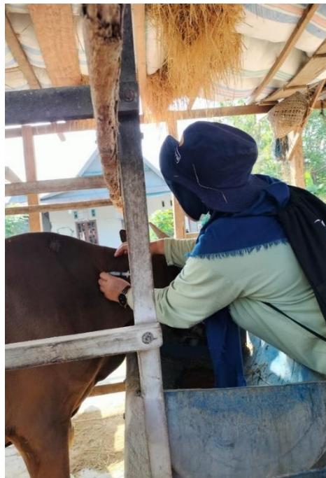
Gambar 5. Vaksinasi Anthrax