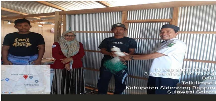
Gambar 6. Penyerahan Bantuan Jaring Insang Tetap