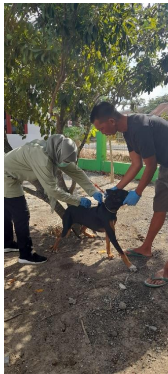
Gambar 3. Vaksinasi Rabies