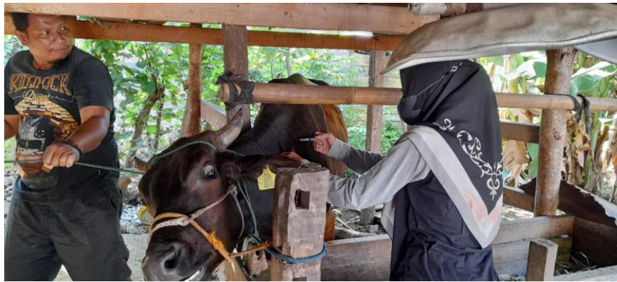
Gambar 4. Vaksinasi PMK