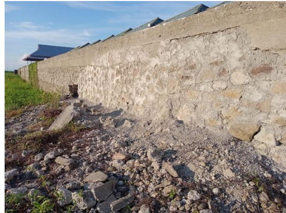
Gambar 1. Rehab Jaringan Irigasi