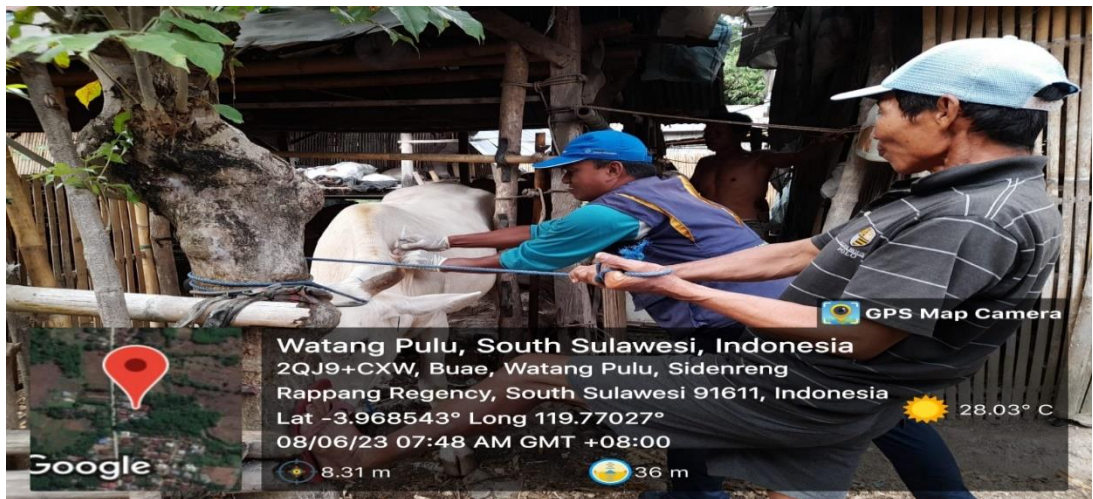
Gambar 7. Vaksinasi Brucella